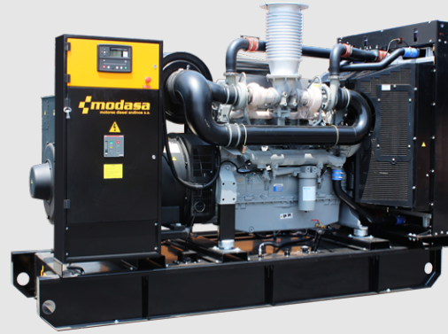
GRUPO ELECTRÓNICO ABIERTO

* Nota: Imágenes referenciales, pueden variar dependiendo de los accesorios