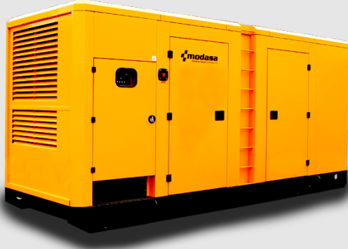
GRUPO ELECTRÓNICO INSONORO