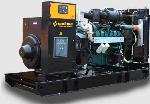
GRUPO ELECTRÓNICO ABIERTO

* Nota: Imágenes referenciales, pueden variar dependiendo de los accesorios