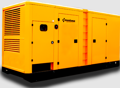
GRUPO ELECTRÓNICO INSONORO