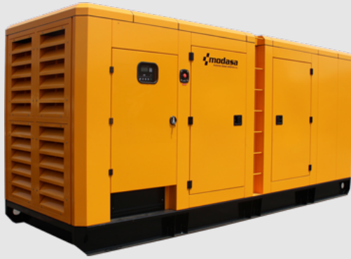
GRUPO ELECTRÓNICO INSONORO