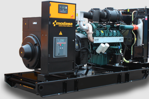
GRUPO ELECTRÓNICO ABIERTO

* Nota: Imágenes referenciales, pueden variar dependiendo de los accesorios