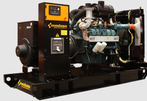
GRUPO ELECTRÓNICO ABIERTO

* Nota: Imágenes referenciales, pueden variar dependiendo de los accesorios