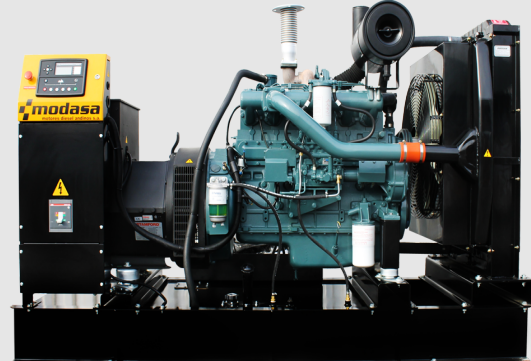
GRUPO ELECTRÓNICO ABIERTO

* Nota: Imágenes referenciales, pueden variar dependiendo de los accesorios